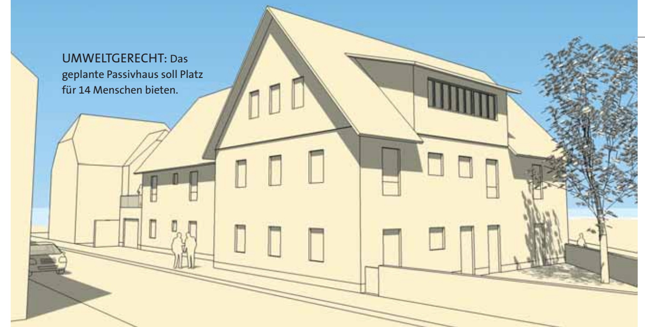
UMWELTGERECHT: Das geplante Passivhaus soll Platz für 14 Menschen bieten.

Fotos: Rose-Marie von Krauss, Gottstein & Blumenstein Architekten BDA