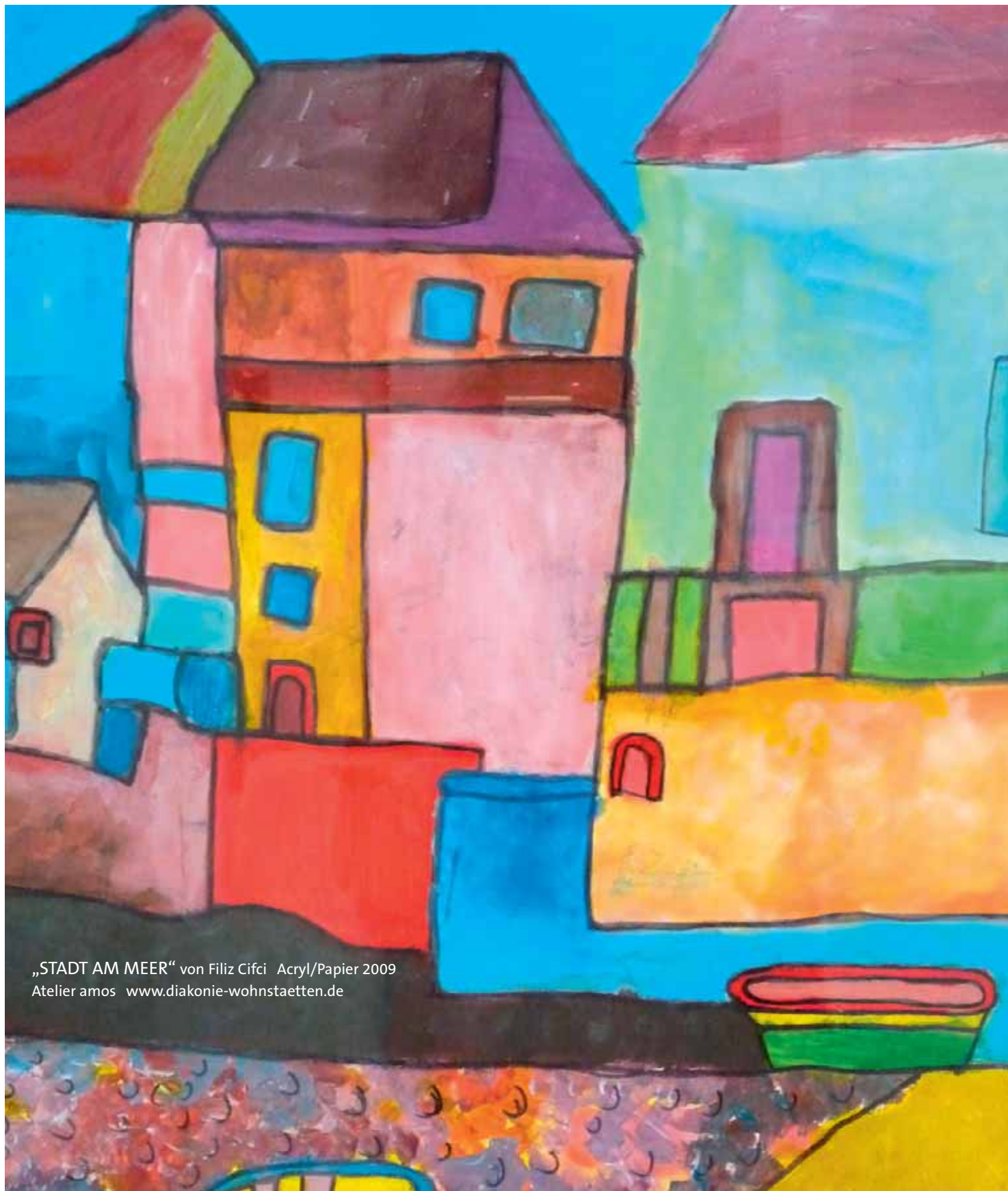
„STADT AM MEER“ von Filiz Cifci Acryl/Papier 2009 Atelier amos www.diakonie-wohnstaetten.de