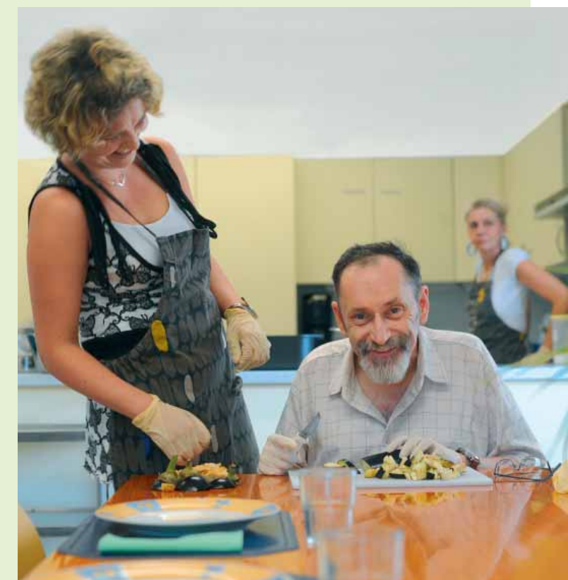
UMBENANNT: Die Tagesförderstätte der Vitos begleitenden psychiatrischen Dienste Rheingau.

auf den Prüfstand gestellt. Wenn möglich, wurde vereinfacht, gekürzt oder gestrichen. Mit dem in allen Medien mitgeführten Hinweis „Ein Unternehmen des LWV Hessen“ wird die Verbundenheit mit dem Alleingesellschafter verständlich vermittelt. Seit Juni sind alle Einrichtungen offiziell in Vitos umbenannt und folgen jetzt einer einheitlichen Namenssystematik. ● Martina Garg