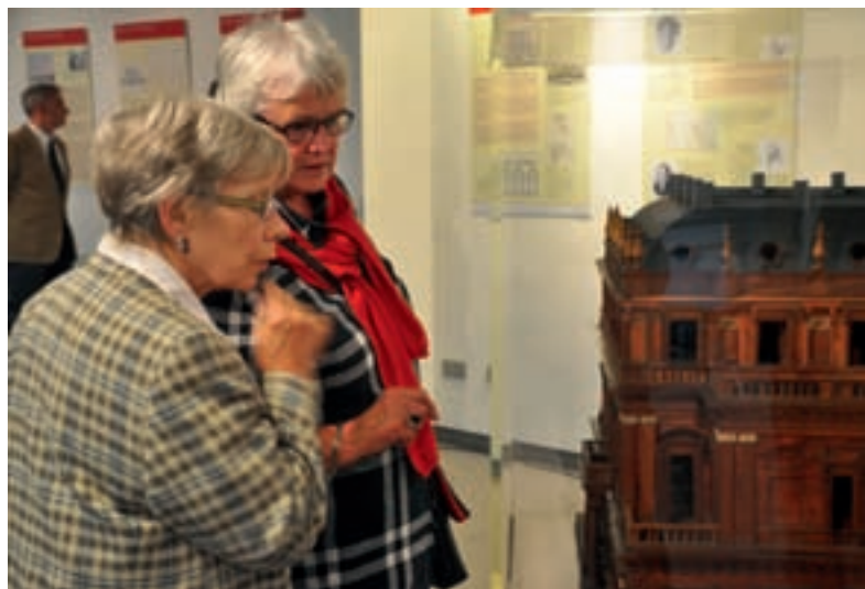
BLICKFANG: Historisches Ständehausmodell in der Ausstellung