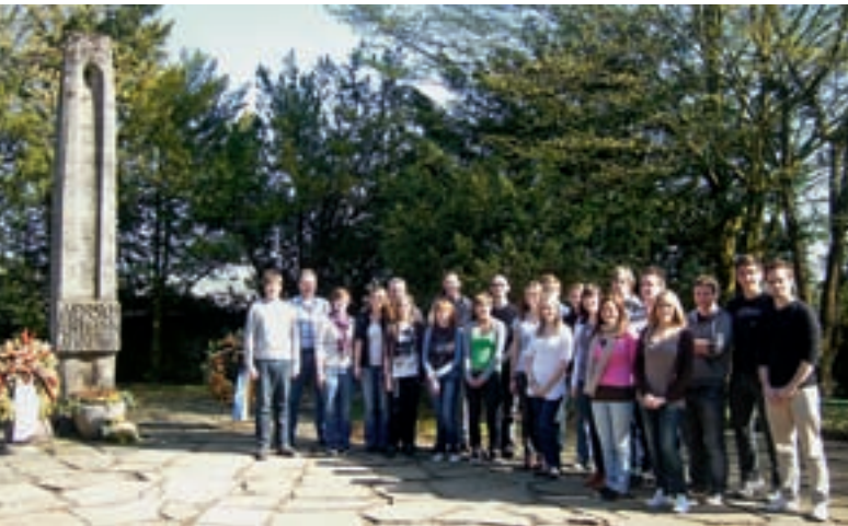
OPFER IN ERINNERUNG BEHALTEN: LWV-Auszubildende besuchen die Gedenkstätte Hadamar.

Die Anlage in Hadamar ist sehr schön, die Landschaft rundherum auch. Es ist ein sonniger, warmer Tag. Doch die Idylle trägt. In einem Keller der damaligen Krankenstation wurden zwischen Januar und August 1941 über 10.000 Menschen mit Behinderung oder einer psychischen Krankheit vergast. Mit