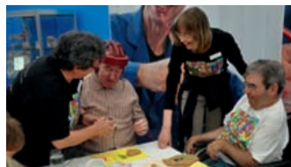
Klienten und Mitarbeiter des Alfred Delp Hauses bemalen Lebkuchenherzen.