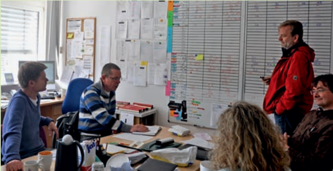
TEAMSITZUNG: Mitarbeiter planen die Woche.