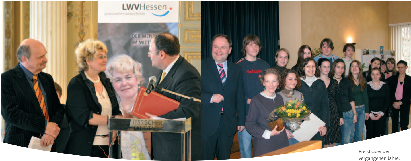
Preisträger der vergangenen Jahre.