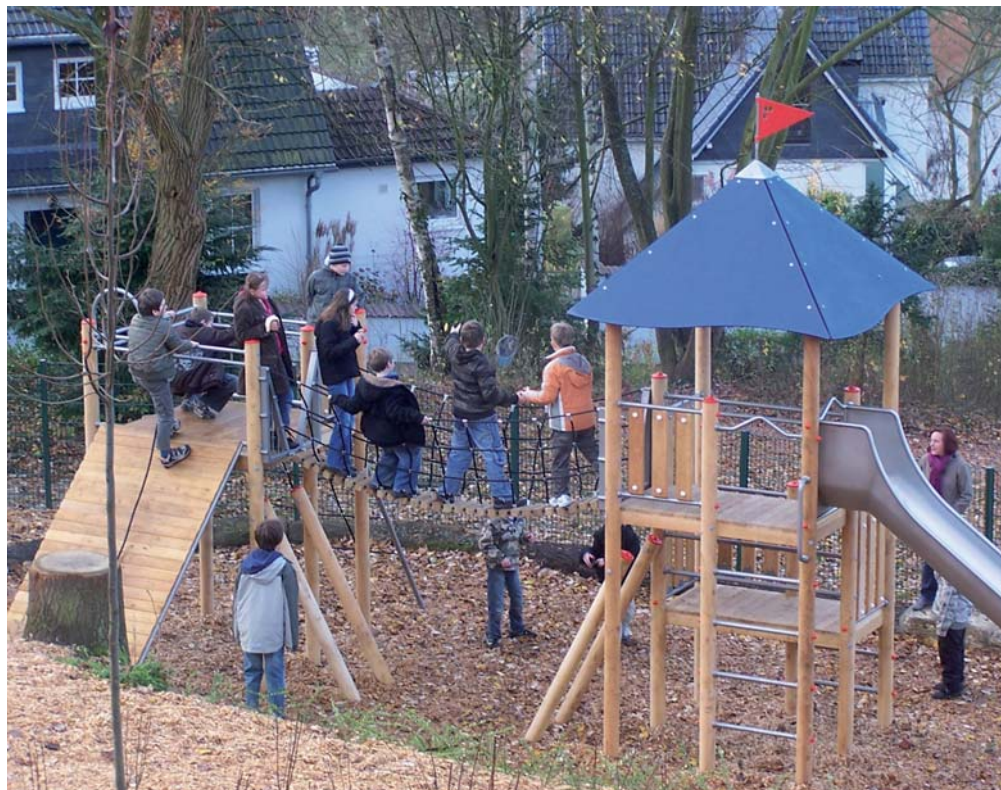
ABWECHSLUNG IM SCHULALLTAG: Der neue Spielturm der Feldbergschule.

Weitere Informationen unter www.lwv-hessen.de > Schulen