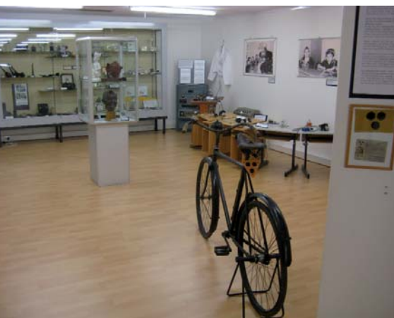
Blick in das Museum.

In Frankfurt gibt es jetzt das erste Museum zur Geschichte der Gehörlosen und Schwerhörigen. Auf 180 Quadratmetern informiert die Einrichtung über das Alltagsleben mit einer Hörbehinderung: Zu sehen ist unter anderem eine außergewöhnliche Sammlung von Hörhilfen vom Hörrohr bis hin zum digitalen Hörgerät. Ausgestellt werden auch „Wundermittel“, die einst die Heilung von Taubheit und Schwerhörigkeit versprachen, sowie Bücher und Bilder zur Gebärdensprache.