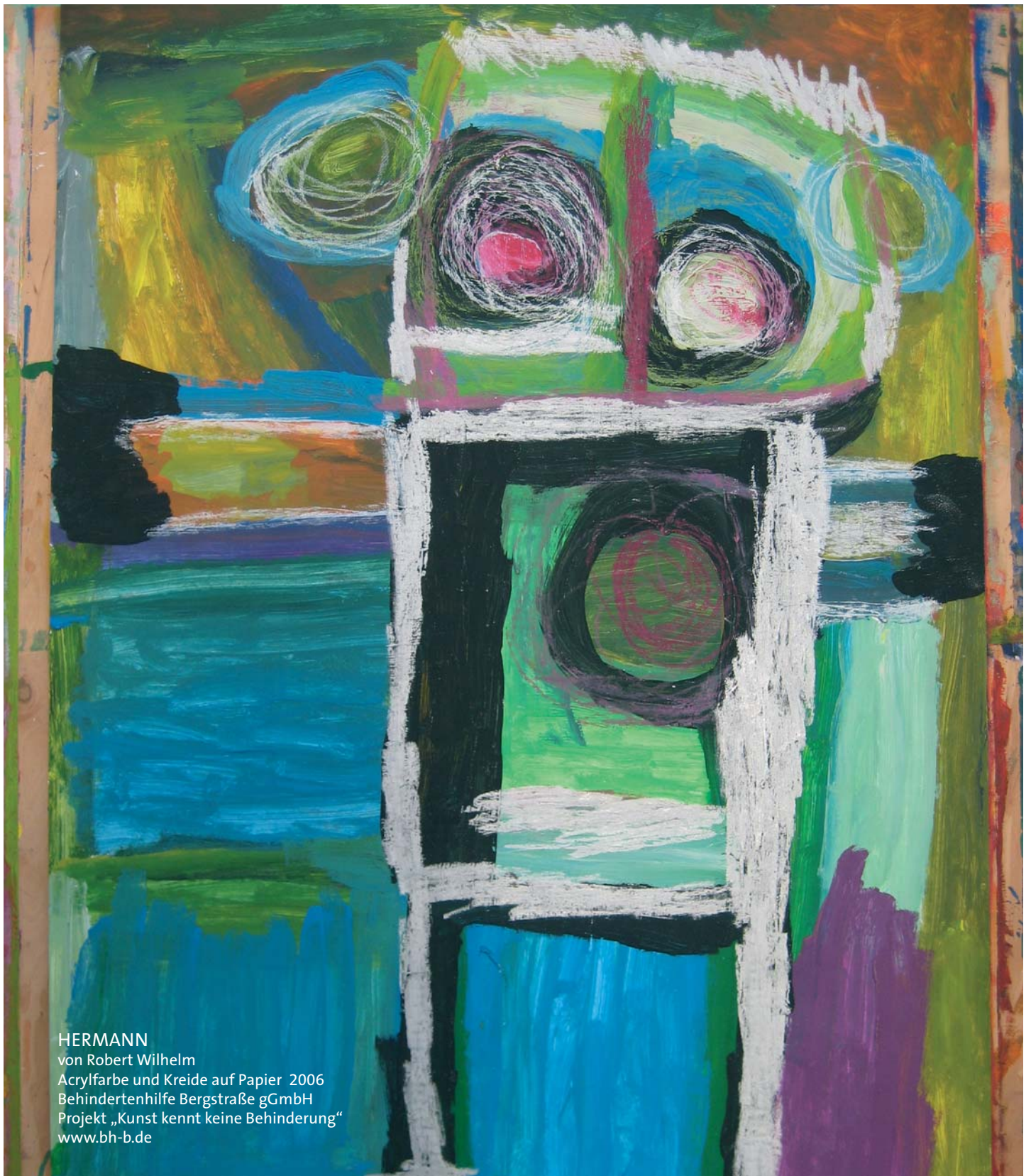
HERMANN von Robert Wilhelm Acrylfarbe und Kreide auf Papier 2006 Behindertenhilfe Bergstraße gGmbH Projekt „Kunst kennt keine Behinderung“ www.bh-b.de

Der Landeswohlfahrtsverband Hessen ist ein Zusammenschluss der Landkreise und kreisfreien Städte, dem soziale Aufgaben übertragen wurden.