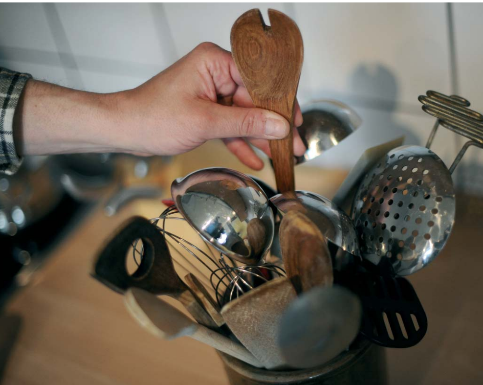
ENTDECKUNG: Kochen ist seine neue Leidenschaft