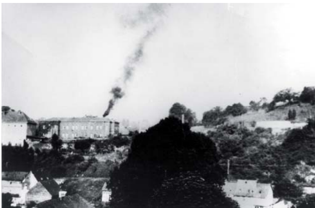
Rauch aus den Krematoriumsöfen über der Gasmordanstalt 1941

Ende 1940 wurde die Landesheilanstalt Hadamar in eine Tötungsanstalt umgebaut. Damit sollte Hadamar neben Brandenburg, Bernburg, Grafeneck, Hartheim und Pirna-Sonnenstein als sechste und letzte „T4“-Gasmordanstalt in die dunkle Geschichte der NS-Psychiatrie eingehen.