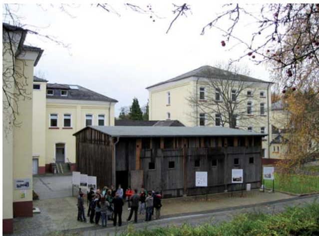
Die ehemalige Busgarage